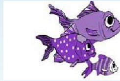
Como Conocerme y mi familia